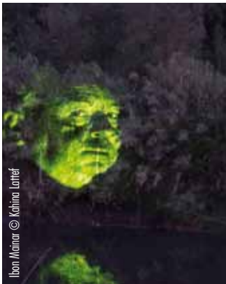
Ibon Mainar