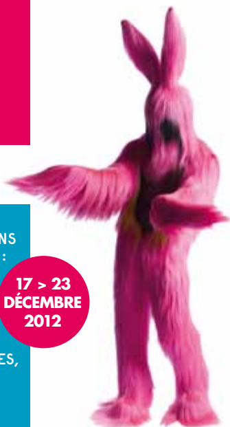
Nick Cave